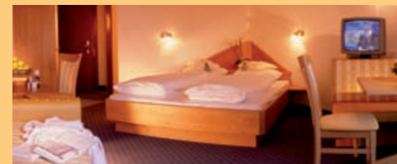
„Sopra le nuvole“ & „Delizia“

Nuova Junior-Suite comfort (38 m 2 ) al 2., 3. o 4. piano con bagno confortevole, WC, bidet, fon, specchio per il trucco, angolo soggiorno, TV satellitare, radio, telefono diretto, accesso internet, cassaforte, minibar e balcone con veduta sulla conca di Merano