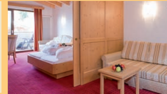
„Raggio di Sole“

Nuove Junior-Suite (da 34 m 2 a 36 m 2 ) al 3 piano con bagno confortevole, WC, bidet, fon, specchio per il trucco, angolo soggiorno, TV satellitare, radio, telefono diretto, accesso internet, cassaforte, minibar e balcone con veduta sulla conca di Merano