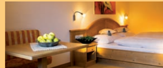
„Fiori d'arancio“ & „Nido di coccole“

Camera doppia (da 25 m 2 a 34 m 2 ) con bagno o doccia, WC, fon, specchio per il trucco, TV satellitare, radio, telefono diretto, accesso internet, cassaforte e balcone