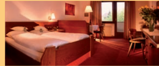
„Classic“ & „Quadrifoglio“

Camera doppia (da 25 m 2 a 34 m 2 ) con bagno o doccia, WC, fon, specchio per il trucco, TV satellitare, radio, telefono diretto, accesso internet, cassaforte e balcone